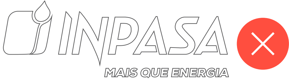
Não utilizar outline