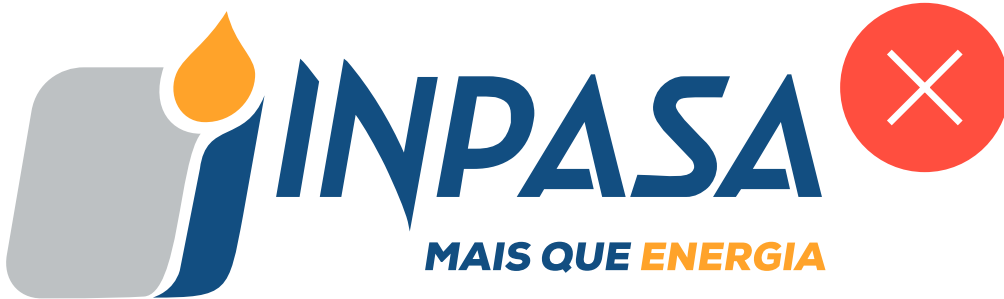
Não desalinhar os elementos